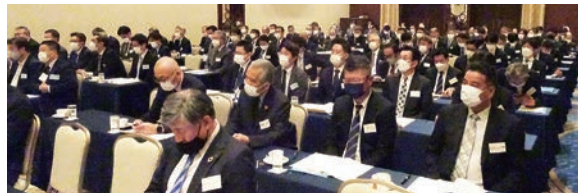
新型コロナウイルス感染対策を徹底するため全員マスク着用の総会