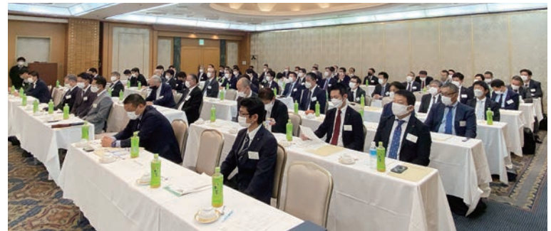
新型コロナウイルス感染対策を徹底して全員マスク着用で開催