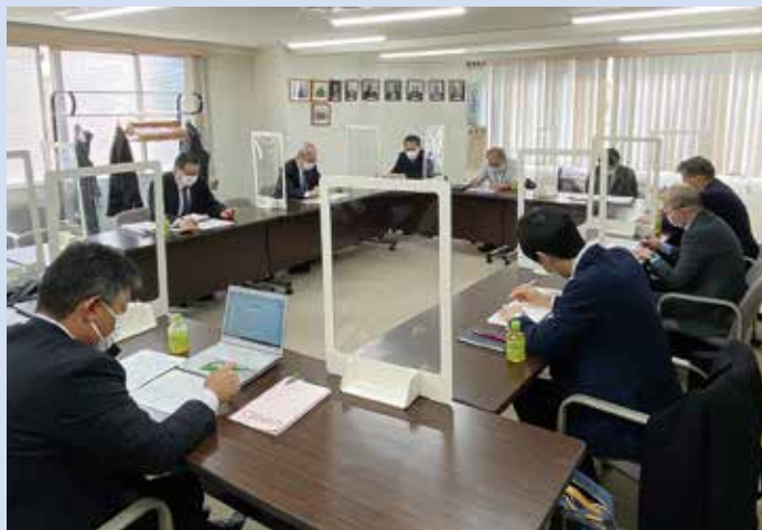
新型コロナウイルス感染対策を講じたうえで開催しました