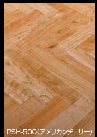
PSH-500(アメリカンチェリー)