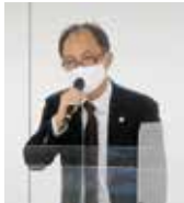
農林水産省林野庁林政部木材産業課課長眞城英一氏