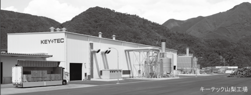
キーテック山梨工場