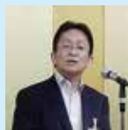
森康氏による中締め