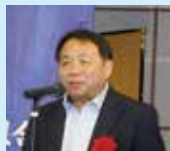
講演会の講師は 評論家・石平氏