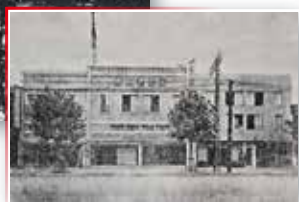
ベニヤ商会本社社屋 東京愛宕町