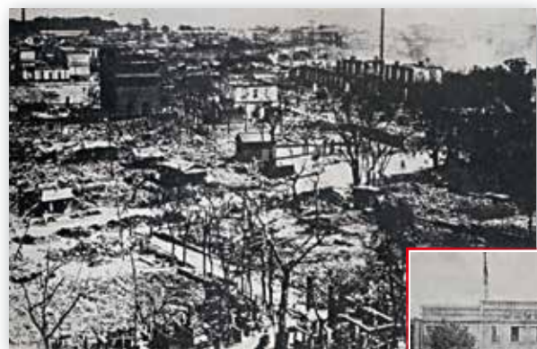
大正12年 関東大震災