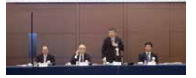
平成30年度 第1回日本合板商業組合役員会

第41回日本合板商業組合通常総会の開催に先立ち、「平成30年度第一回日本合板商業組合役員会」を開催。全議案が全会一致で承認されました。