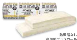
防湿層なし 高性能グラスウール