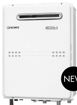
〈スタンダードタイプ〉 GTH-C2449AWD-2 BL