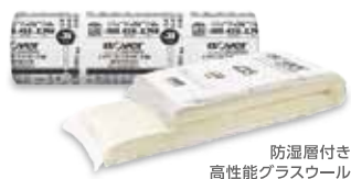
防湿層付き 高性能グラスウール