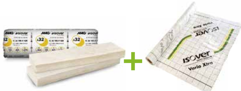
防湿層なし高性能グラスウール断熱材 ISOVER Comfort イソベル・コンフォート