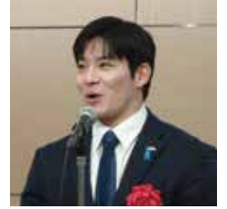
福井県知事 石田嵩人氏による 懇親会来賓挨拶